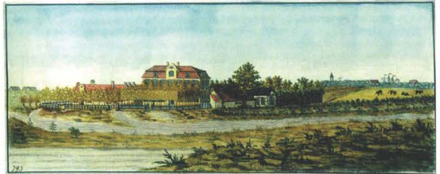
J. Kabrun Dwór w Myrskach k. Gdańska