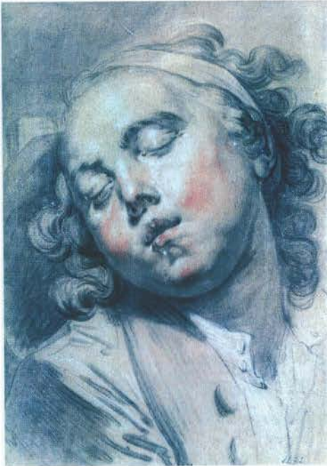
J.E. Zeizing (Sचनाun) Studium portretowe dziewczyny z kolekcji J. Kabruna

S traty Kultury Polskiej, Wspólne Dziedzictwo, Materiały i Dokumenty, Informatory o zbiorach polskich za granicą – to serie wydawnicze publikacji Ministerstwa Kultury i Dziedzictwa Narodowego, które mimo braku reklamy i metod dystrybucji zyskały zainteresowanie i uznanie licznych czytelników. Książki z tych serii osiągają nawet wysokie ceny na zagranicznych aukcjach internetowych i na ich wznowienie czeka wiele osób zarówno w kraju, jak i zagranicą.