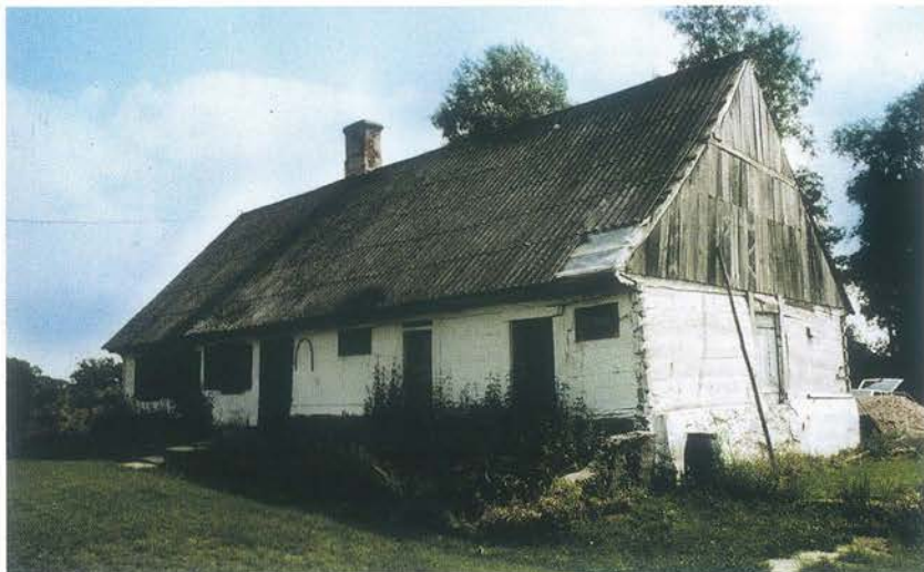
Chalupa z 1880 r. uratowana przed zniszczeniem przez mieszkańca Płocka, obecnie użytkowana jako dom letniskowy. Godny podkreślenia jest fakt pozostawienia domostwa w praktycznie niezmiennym stanie (zachowany tradycyjny system ognienny)

■ edukacja środowisk skupionych wokół idei ochrony zabytków ludowych związanych z osadnictwem holenderskim, uczelni i studentów.