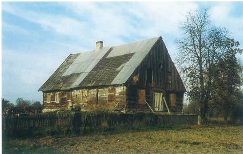
Najstarszy datowany budynek holenderski na Mazowszu z 1806 r. – zbor mennonicki w Sadach, gm. Służbice (stan z 2000 r.)

Pierwszy etap katalogu zakłada udokumentowanie materialnego dziedzictwa kulturowego związanego z osadnictwem holenderskim w Polsce, trwającym w naszym kraju nieprzerwanie od XVI do lat 40. XX w. – tj. wiejskich osad, zagród, budynków – zarówno mieszkalnych, jak i gospodarczych, a także zborów i cmentarzy znajdujących się do tej pory na Pomorzu, Mazowszu, Podlasiu, w Małopolsce, Wielkopolsce, na Kujawach, Ziemi Łęczyckiej