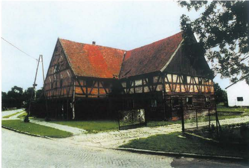
Żuławski dom podcieniowy charakterystyczny dla pierwszego okresu kolonizacji

Osadnictwo holenderskie w Polsce, obejmujące nieużytkowane zalewowe tereny położone wzdłuż cieków wodnych (Wisły, Bugu, Wkry i innych), zostało stworzone i przyniesione na tereny Rzeczypospolitej w XVI w. przez kolonistów holenderskich pochodzących z Fryzji i Flandrii, których napływ spowodowany został z jednej strony prześladowaniami religijnymi, z drugiej zaś względami praktycznymi: koloniści reprezentowali wysoki poziom gospodarki i kultury osadniczej, przez co byli osadnikami wysoce pożądanymi.