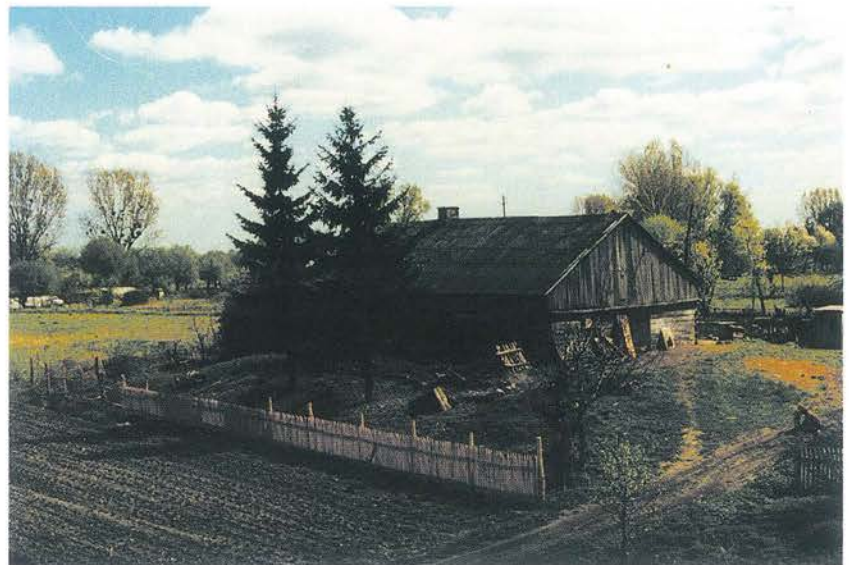
Wilków nad Wisłą – jedno z licznych siedlisk „dędenkich” z chatką ulokowaną na wzgórku, otoczona płotem za sztucznymi nasadzeniami drzew i krzewów w tle

Tym bardziej należy chronić i propagować pozostałości tej kultury, która w tak