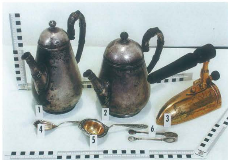
Błędna ocena wywożonych przedmiotów powoduje, że za zabytki służby graniczne uznają często przedmioty nimi nie będące

Walka z nielegalnym wywozem, którego źródłem są zorganizowane grupy przespęczne jest bez wątplenia bardzo trudna, ale nie można powiedzieć, że są to działania