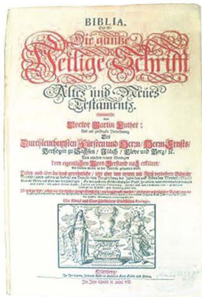
2-3. Skradziona z Pszczyny Biblia została odzyskana w dniu kradzieży na przejściu granicznym pomiędzy Czechami a Niemcami