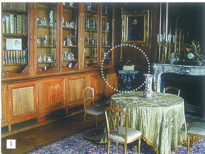
1. Muzeum w Pszczynie. Zabytkową Biblię skradziono z jednej z sal wystawowych, z pulpitu, na którym była eksponowana.