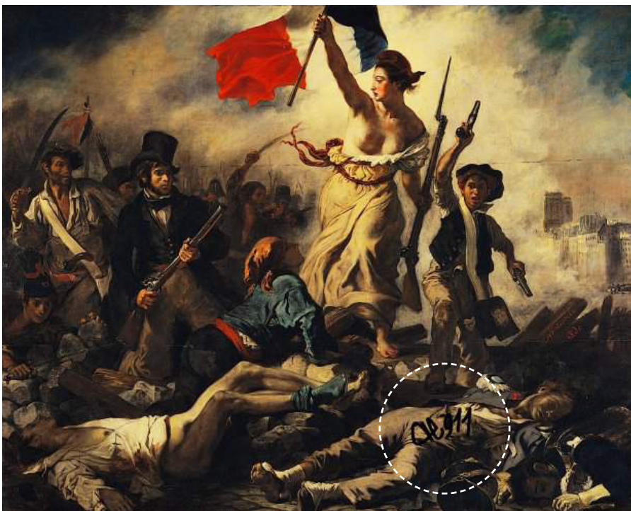
Napis AE911 na obrazie Eugène'a Delacroix Wolność wiodąca lud na barykady .

do muzeum i dokonało kradzieży. Zdarzenie to wiąże się również ze skandalem, jakim było wystawienie kilka miesięcy później jednego ze skradzionych eksponatów, lekko zmodyfikowanego, na aukcji w Sotheby's. Biała prostokątna praca, składająca się z bloków wypełnionych trójkątami, opatrzona została znakiem „R69-32” (wskazanie roku powstania dzieła i znak identyfikacyjny). Znak wystawionego na aukcji dzieła został zmieniony: cyfrę 32 przerobiono na 39. Mimo zgłoszenia przez organizację Art Lost Register wątpliwości co do pochodzenia dzieła, w czerwcu zostało ono sprzedane za 213 tys. euro.