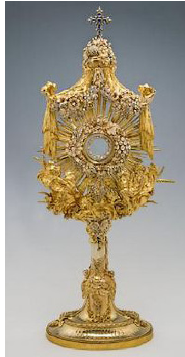
Monstrancja skradziona z Muzeum Catharijneconvent