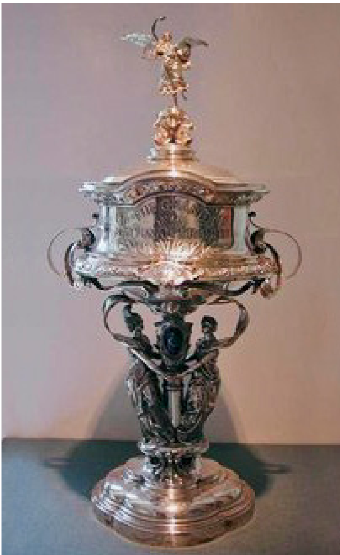
Puchar skradziony z National Museum of Racing and Hall of Fame w Nowym Jorku.