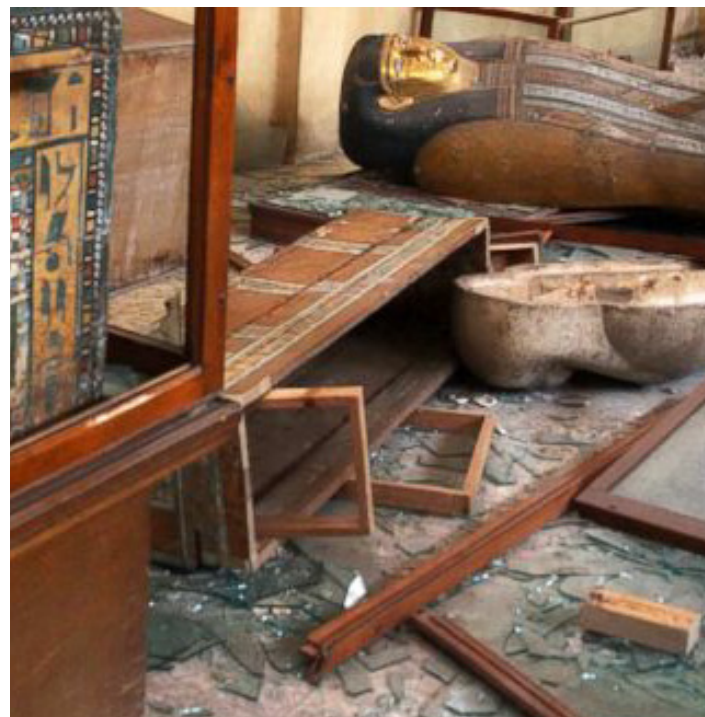
Efekty zniszczeń w Muzeum Malawi w Egipcie.

Stany Zjednoczone. Do budynku Sedro-Woolley Museum w okolicach Waszyngtonu dostał się będący pod wpływem narkotyków sprawca, nagi. Zaalarmowana przez ochronę policja zatrzymała przestępcę i odebrała mu skradzione eksponaty. Wprawdzie przestępcy nie udało się wynieść z muzeum obiektów będących pamiątkami historycznymi ofiarowanymi przez okolicznych mieszkańców, ale włamanie spowodowało duże szkody w budynku muzealnym.