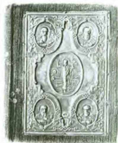
61 a, b. Pismo Święte (Ewangelia) Kijów, 1893 r. Papier, tektura, welur, blacha mosiądzowana, tłoczenie, druk, 19,5 x 16 x 5,5 cm KAT. RR-824