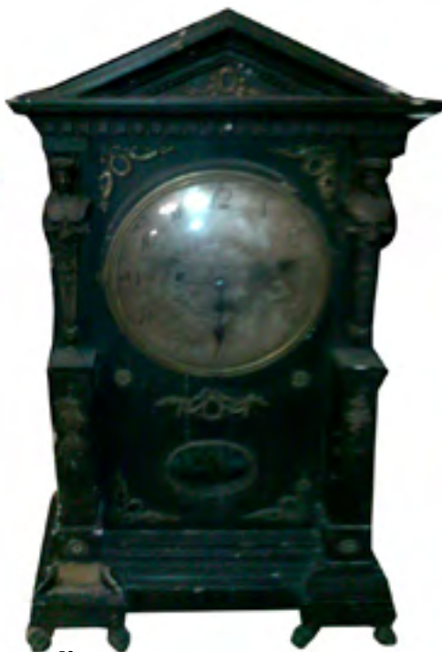
57. ZEGAR szafkowy, wiszący, firma GUSTAW BECKER, ok. 1910 r. Skrzynia z drewna, ok. 120 x 40 cm KAT. RP-187