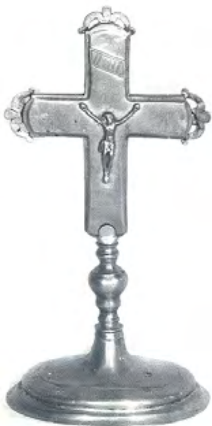
52 a, b

52 a, b PACYFIKAŁ 1790 r. Srebro trybowane, wys. 30 cm KAT. RH-620