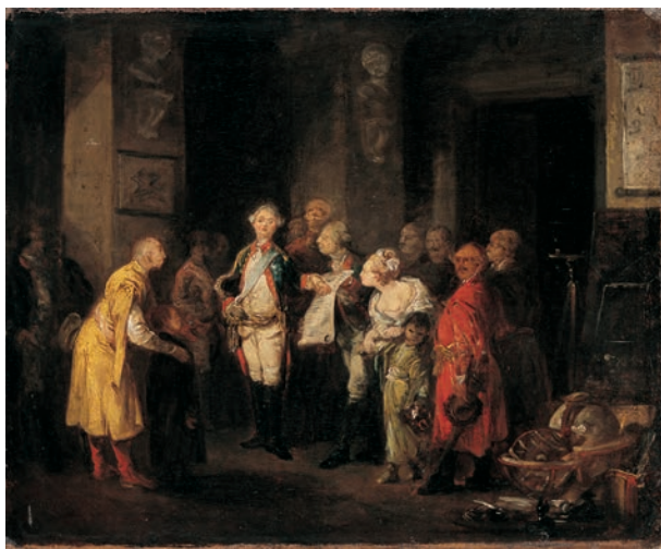
Jan Piotr Norblin de la Gourdain (1745 – 1830), Książę Adam Kazimierz Czartoryski w Korpusie Kadetów , 1774-1782, olej, płótno, 44,5 x 35,8 cm