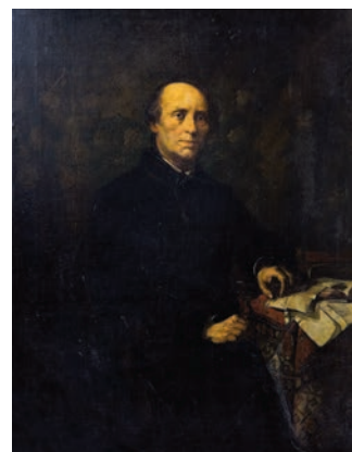
Wacław Koniuszko (1854 – 1899), Portret Juliana Bartoszewicza , 1879 r., olej, płótno, 131,5 x 101 cm