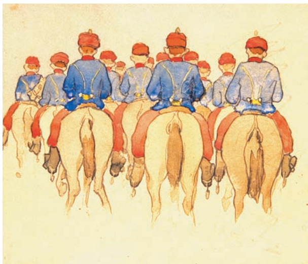
Artur Grottger (1837-1867), Escadron Schmitt , akwarela, papier, 16,5 x 20,3 cm