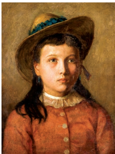
Ferdynand Stanisław Bryll (1863 – 1922), Dziewczynka w słomkowym kapeluszu , olej, tektura, 49 x 38 cm

Projekt założenia Muzeum Przemysłu, Rolnictwa i Sztuki zrodził się w 1884 roku, z tego roku pochodzi bowiem bodaj najwcześniejszy artykuł w łódzkiej prasie w tej sprawie 2 .