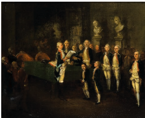
Jan Piotr Norblin de la Gourdain (1745 – 1830), Król Stanisław August Poniatowski w Korpusie Kadetów , 1774 – 1782, olej, płótno, 45 x 35,8 cm

Poniatowskiego, archiwalia do dziejów konfederacji barskiej (m.in. Teki Wessla), listy Joachima Lelewela oraz tzw. Silva rerum szlacheckie . Część tego archiwum stanowiły listy literatów: Henryka Sienkiewicza, Józefa Ignacego Kraszewskiego, Kornela Ujejskiego, Jana Kasprowicz, Marii Konopnickiej.