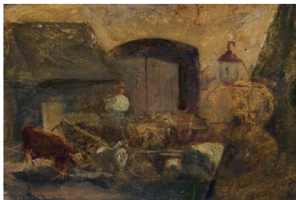
Aleksander Kotsis (1836 – 1877), Podwórko , olej, płótno naklejone na tekturę, 14,7 x 20,7 cm

przed kilku laty badań 30 autorem obrazu jest najprawdopodobniej artysta południowoniemiecki spoza warsztatu Cranachów, działający w 2. poł. XVI w. Sposób malowania i proces tworzenia kompozycji pozwalają sądzić, że autor znał zasadnicze tajniki warsztatu Cranachów. Stąd też przypuszczenie, iż mógł on być wcześniej (czasowo) związany z warsztatem wittenberskiego mistrza. Obraz jednak posiada cechy, które nie pozwalają uznać go za dzieło powstałe bezpośrednio w warsztacie Lucasa Cranacha Starszego. 31