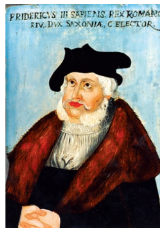
Naśladowca Lucasa Cranacha Starszego, Portret Fryderyka III Mądrego , 2. poł. XVI w., tusta tempera, olej, drewno lipowe, 22 x 15,7 cm