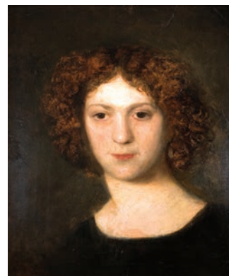
Aleksander Kotsis (1836 – 1877), Rudowłosa , olej, płótno, 50 x 40 cm