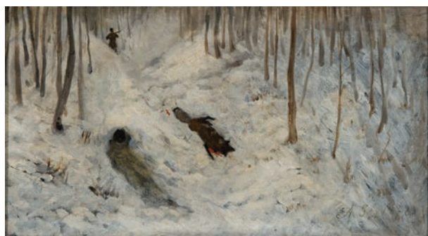
Antoni Piotrowski (1853 – 1924), Polowanie na lisa , 1878 r., olej, płótno, 26 x 50 cm