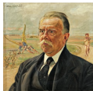
Vlastimil Hofman (1881 – 1970), Portret Kazimierza Bartoszewicza , 1918 r., olej, płótno, 60,5 x 60,5 cm