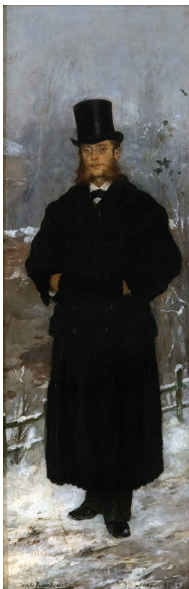
Witold Pruszkowski (1846 – 1896), Portret Kazimierza Bartoszewicza , 1876 r., olej, płótno, 128,5 x 41 cm