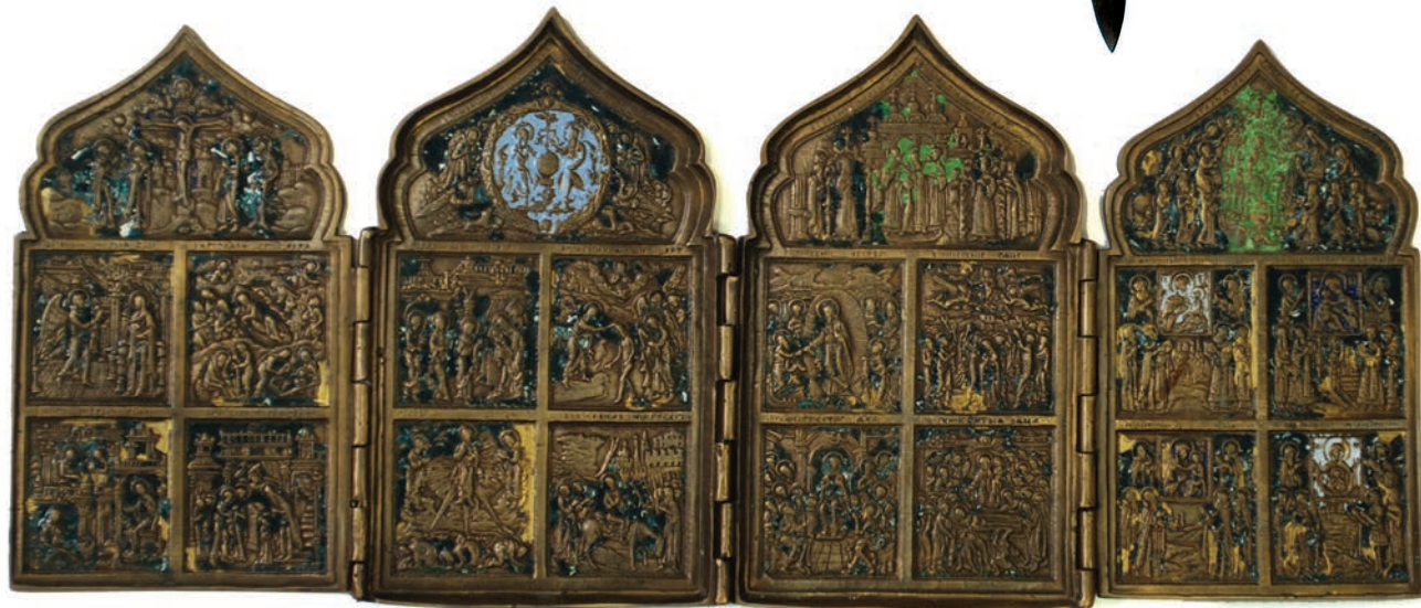
Ikona podróżna 4-częściowa (tzw. tetraptyk) ujawniona w lutym 2007 r. w PSG Poznań – Ławica