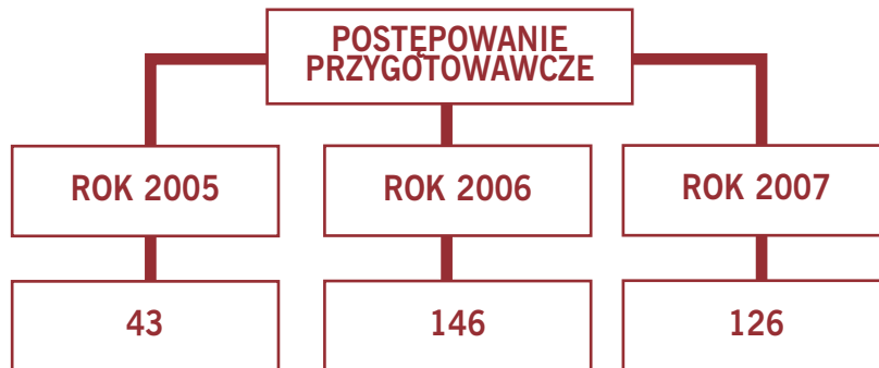
Wykres liczby postępowań przygotowawczych prowadzonych przez Straż Graniczną w przedmiocie zabytków w latach 2005–2007