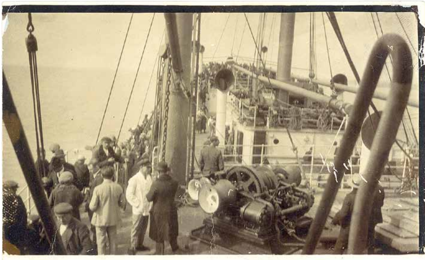
Emigranci polscy płynący do Ameryki Łacińskiej na pokładzie francuskiego statku „Groix”, 1927, Archiwum Akt Nowych, Akta Michała Gieyszтора, sygn. 27, s. 4