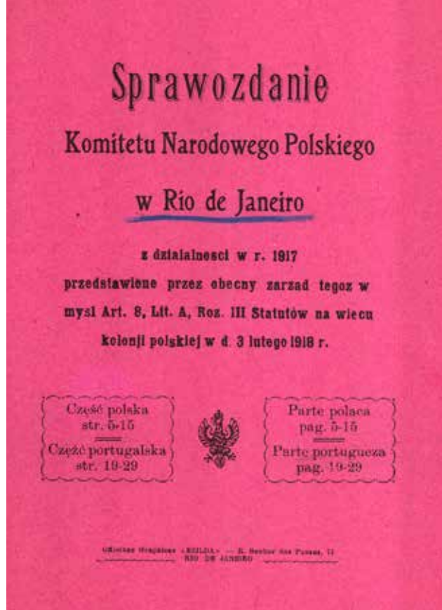
Sprawozdanie Komitetu narodowego Polskiego w Rio de Janeiro, Rio de Janeiro 1917, Archiwum Akt Nowych, Komitet Narodowy Polski w Paryżu, sygn. 17, s. 2

Historia polskiego wychodźstwa zatoczyła koło i odnośnie zjawisk występujących od 2. połowy XX w. można mówić ponownie o podobnych aspektach i motywach migracji ludności, jakie przyświecały pierwszym falom emigracyjnym w XIX w. Poza wyjątkowymi sytuacjami, jakie miały miejsce chociażby przy okazji Października 1956 i Marca 1968 r. czy też na począt-