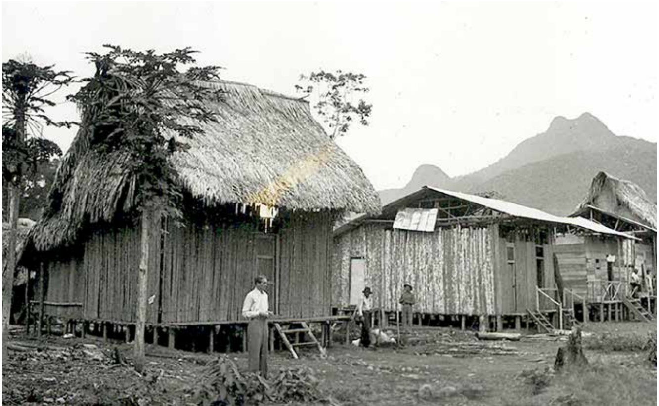
Domy osadników w miejscowości Tingo Maria w Peru, 1929