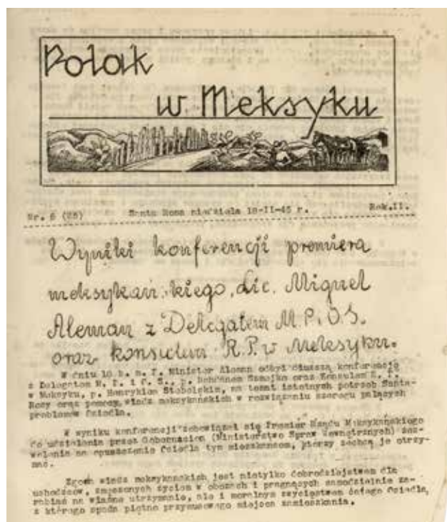
Strona tytułowa czasopisma „Polak w Meksyku” wydawanego w obozie polskich uchodźców wojennych w Meksyku, w Santa Rosa

W trzeciej, ostatniej grupie, powstałej jako zbiór kolekcji prywatnych i spuścizn 30 osób bezpośrednio związanych z polskim wychodźstwem, zachowało się sporo dokumentów wytworzonych w środowisku emigracyjnym i tego środowiska dotyczących. Mają one o tyle dużą wartość, że bezpośrednio dotyczą problemu Polaków poza granicami kraju, ich trosk dnia codziennego i walki o zachowanie tożsamości. Jest to najbardziej pod względem chronologicznym grupa akt, które sięgają końca wieku XVIII aż po dzień dzisiejszy. Oczywiście najliczniej reprezentowane są dokumenty powstałe na przełomie XIX i XX w. oraz w okresie międzywojennym i tuż po wojnie. Skupiają się one głównie na problematyce przebiegu emigracji polskiej oraz stanie, liczebności i położeniu osadnictwa polskiego, a także na analizie relacji wewnętrznych w skupiskach emigracyjnych. Licznie występują dokumenty związane z działalnością polskich organizacji i instytucji emigracyjnych, imprez, zjazdów, posiedzeń itp. Zachowane są akta redakcyjne niektórych tytułów prasy polonijnej wraz z ich egzemplarzami. Pojawiają się także opracowania i dokumenty mówiące o planach i projektach dalszej ekspansji kolonizacyjnej, w tym na obszarze Ameryki Łacińskiej. Podobnie jak w innych grupach