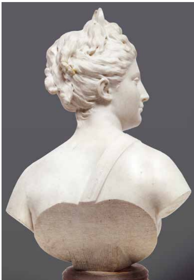
Fotografia Diany z Katalogu Aukcyjnego nr 107 „Antiques” domu im Kinsky w Wiedniu, poz. 0886

Obiekt po wojnie uznano za zaginiony. W 1958 r. umieszczony został wraz z fotografią w katalogu Straty wojenne Polski w dziedzinie rzeźby , opracowanym przez Biuro Rewindykacji i Odszkodowań Ministerstwa Kultury i Sztuki 11 . Dzieło zare-