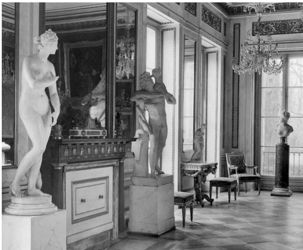
Wnętrze Pałacu na Wodzie, Diana widoczna po prawej stronie, na tle okna, zdjęcie z 1933 r., fot. Instytut Sztuki Polskiej Akademii Nauk, Zbiory Fotografii i Rysunków Pomiarowych

Absolwentka historii sztuki na Uniwersytecie Kardynała Stefana Wyszyńskiego. W latach 2008–2013 pracownik Wojewódzkiego Urzędu Ochrony Zabytków w Warszawie, w latach 2013–2014 zatrudniona na stanowisku Specjalisty ds. Badania Pochodzenia Zbiorów, od 2014 r. pracownik Wydziału Strat Wojennych w Ministerstwie Kultury i Dziedzictwa Narodowego. Zajmuje się prowadzeniem spraw restytucyjnych ze szczególnym uwzględnieniem Rosji i krajów rosyjskojęzycznych.