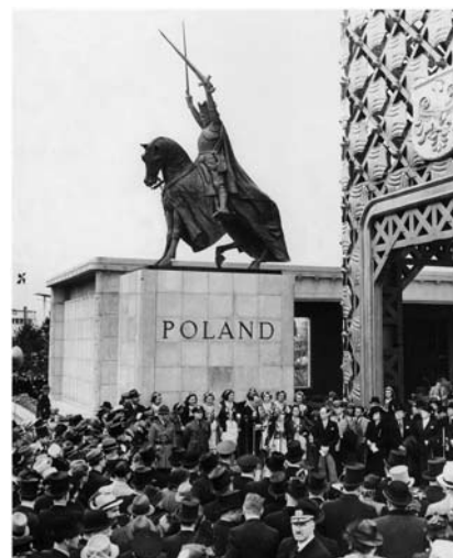
Otwarcie pawilonu polskiego na wystawie światowej w Nowym Jorku, kwiecień 1939 r.