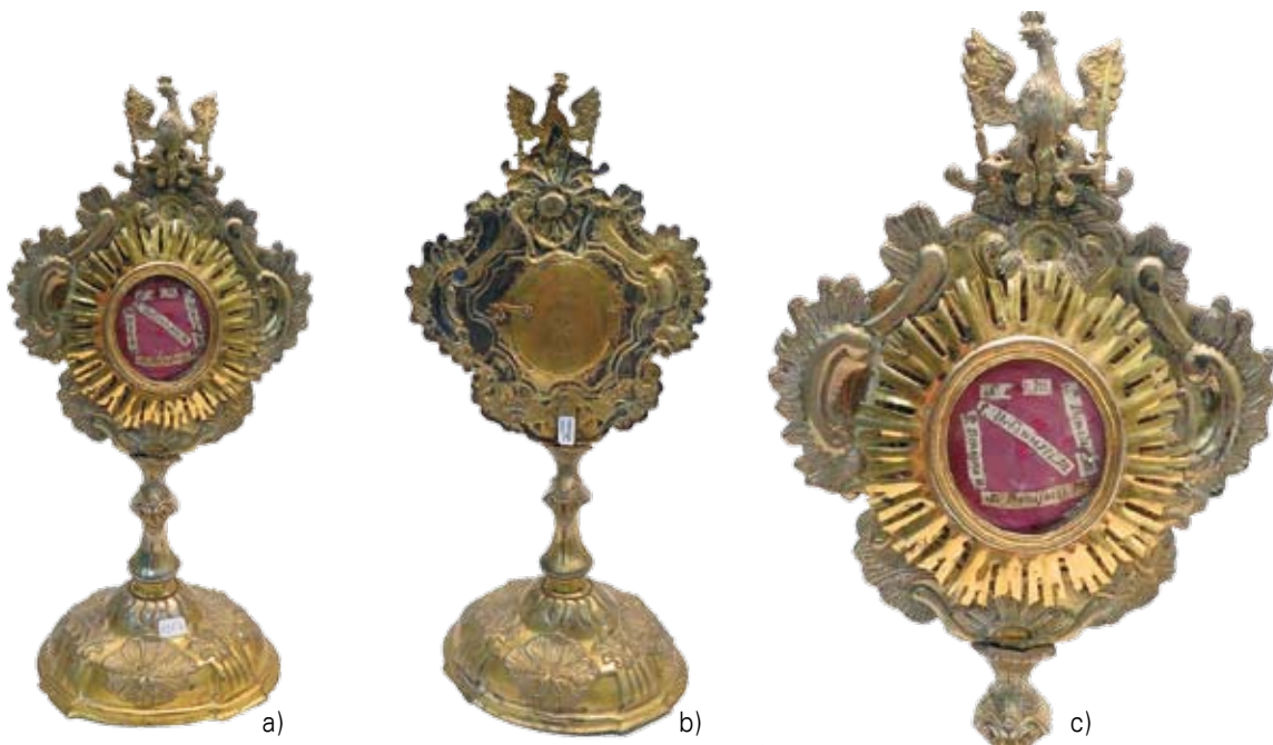
Relikwiarz z kościoła w Kopczyńcach, awers (a), rewers (b), fragment awersu (c).

17 maja 2014 r. na 336. aukcji w antykwariacie Van Ham w Kolonii wśród oferowanych do sprzedaży okazów europejskiego rzemiosła artystycznego znalazło się interesujące polonicum – relikwiarz, określony jako Reliquienmonstranz , pochodzący z kościoła w Kopczyńcach, oznaczony stosownym napisem, herbem biskupa Mikołaja Dembowskiego i datą 1757. Wraz z relikwiarzem sprzedawano pergaminowy dokument donacyjny wystawiony przez fundatora 1 . Wzięcie udziału w tej aukcji, rozważane przez Ministerstwo Kultury i Dziedzictwa Narodowego, z racji bardzo krótkiego czasu potrzebnego do załatwienia niezbędnych formalności okazało się niemożliwe 2 . Zabytek został w czasie aukcji sprzedany. Nabywca nie jest znany.