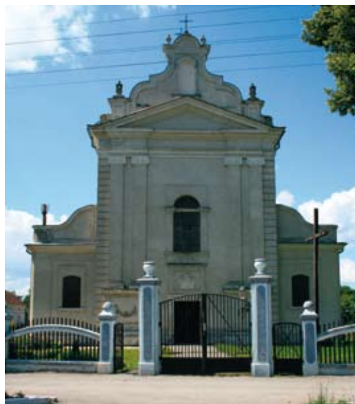
Kopyczyńce, kościół parafialny, stan obecny.