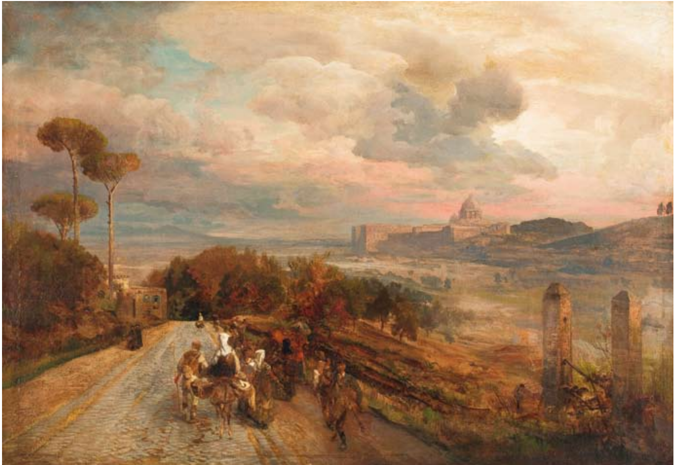
Oswald Achenbach, Via Cassia koło Rzymu , 1878 r., olej, płótno; 39 x 55 cm.