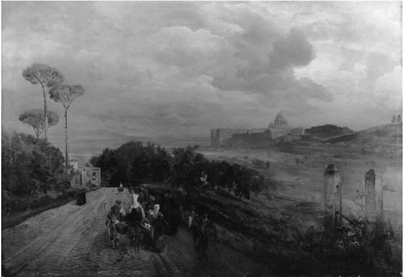
Przedwojenny negatyw z fotografii obrazu ze zbiorów Muzeum Narodowego we Wrocławiu.

gromadził swą kolekcję z intencją wzbogacenia zbiorów ówczesnego Schlesisches Museum der bildenden Künste we Wrocławiu. Po jego śmierci w 1907 r. i zgodnie z ostatnią wolą zbiór ok. 100 obrazów i kilku rzeźb został przekazany do Śląskiego Muzeum Sztuk Pięknych we Wrocławiu. Był to jeden z cenniejszych darów, jakie otrzymała wrocławska placówka. Finalnie został wyeksponowany w dziewięciu sąsiadujących salach muzealnych na I piętrze gmachu. Zbiór składał się głównie z obrazów malarzy niemieckich ostatniej ćwierci XIX w. Wśród nich znalazło się płótno Via Cassia , które zostało wpisane do muzealnej księgi przyjęć pod numerem 14010. Protokoły o przyjęciu wartościowej darowizny przez muzeum były zamieszczane w corocznych sprawozdaniach z posiedzeń zarządu, kierowanych do opiekuna i powierników. O wydarzeniu tym pisała nawet lokalna prasa, ponieważ tak znacząca rozbudowa kolekcji muzealnej pozwoliła istotnie podnieść rangę instytucji, zarówno