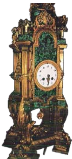
31. CLOCK 19th/20th cent. Bronze (?), onyx, height 80 cm Cat. RP-203