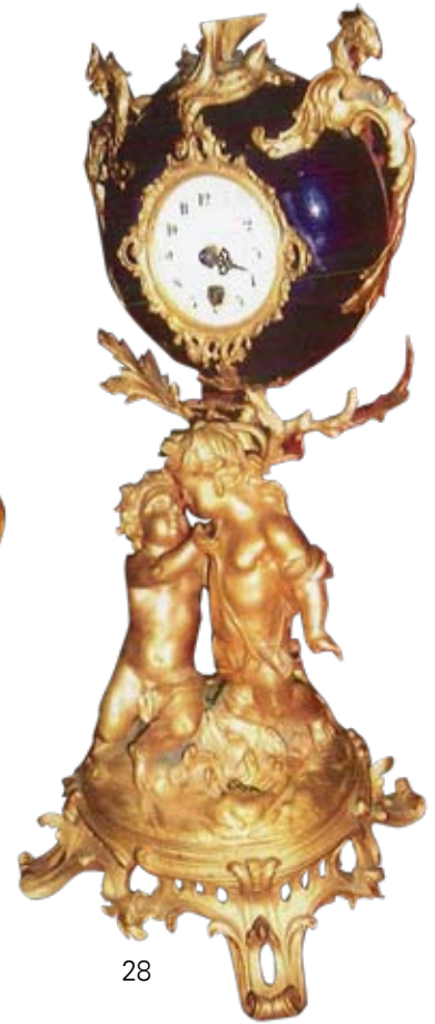
31. ZEGAR XIX/XX w. Brąz (?), onyks, wys. 80 cm Kat. RP-203