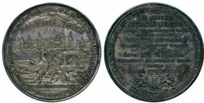
Medal na 300 rocznicę przyłączenia Prus do Polski, 1754 r. (ze zbiorów archiwum Narodowego Muzeum Sztuk Pięknych im. A.S. Puszkina)