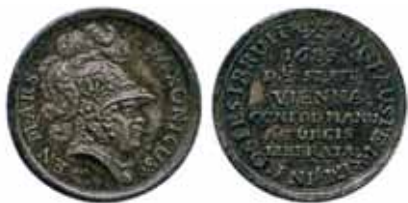
Johann George III (1680–1691). Na pamiątkę wyzwolenia Wiednia z tureckiej niewoli (ze zbiorów archiwum Narodowego Muzeum Sztuk Pięknych im. A.S. Puszkina)