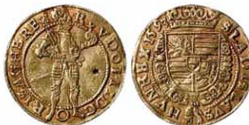
Dukat z 1593 r.