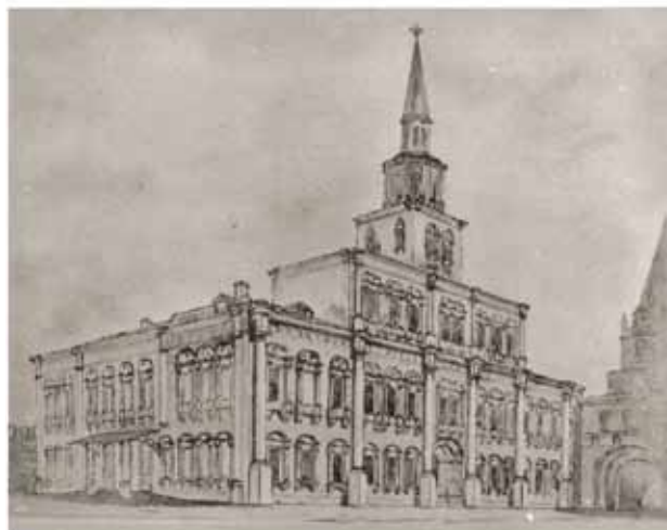
Budynek Apteki Głównej

W grudniu 2008 r., w trakcie kwerendy w Archiwum Rosyjskiej Akademii Nauk w St. Petersburgu, udało mi się odnaleźć materiały archiwalne dotyczące zakupu kolekcji: oryginał kontraktu, rozliczenia finansowe, wykaz Stanisława hrabiego Sołtyka zawierający dokumentację kolekcji z sierpnia 1801 r., spis z natury sporządzony przy pakowaniu przez W.M. Sewiergina (część mineralogiczna) i A.F. Sewastianowa (część zoologiczna i botaniczna) oraz relacje dotyczące procedury zakupu zamieszczone wśród sprawozdań z posiedzeń Akademii w Petersburgu. Zafascynowana odnalezionymi archiwaliami, dalsze badania poświęciłam poszukiwaniom materialnych śladów siemiatyckiego gabinetu historii naturalnej. Okazało się to bardzo trudnym zadaniem z powodu łączenia kupowanych kolekcji i niedbania o zachowanie proveniencji eksponatów oraz późniejszego rozproszenia zbiorów w czasie tworzenia wyspecjalizowanych placówek. Nieodwracalne straty przyniosły jednak dramatyczne wydarzenia podczas pożaru Moskwy w 1812 r. W czasie okupacji Moskwy przez wojska Napoleona w dniach od 2 do 6 września (14–18 września) spłonął m.in. Uniwersytet i biblioteka Buturlina, a wiele wskazywało też na to, że zbiory z kolekcji Jabłonowskiej