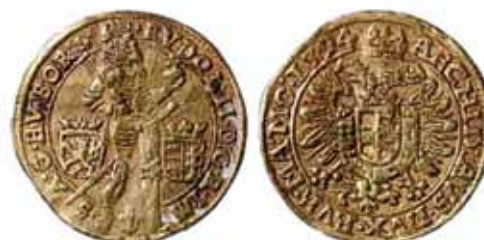
Dukat z 1594 r. [ze zbiorów archiwum Narodowego Muzeum Sztuk Pięknych]