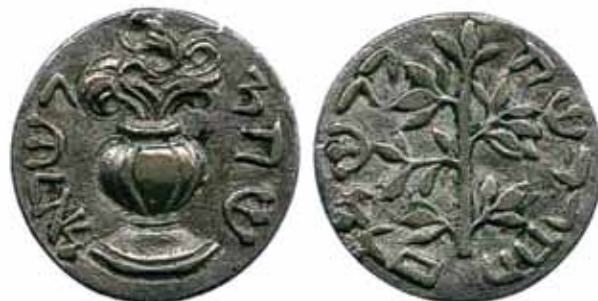
Imitacja szekła hebrajskiego, XVIII w. [ze zbiorów archiwum Narodowego Muzeum Sztuk Pięknych im. A.S. Puszkina]