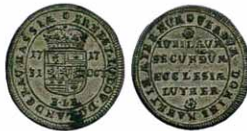
Hesse-Darmstadt. Ernst Ludwig