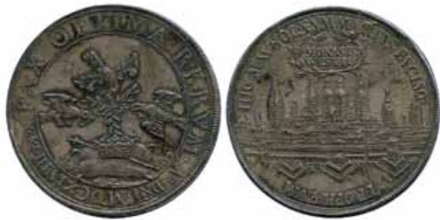
Engelbert Kettler. Na zawarcie pokoju westfalskiego w 1648 r.