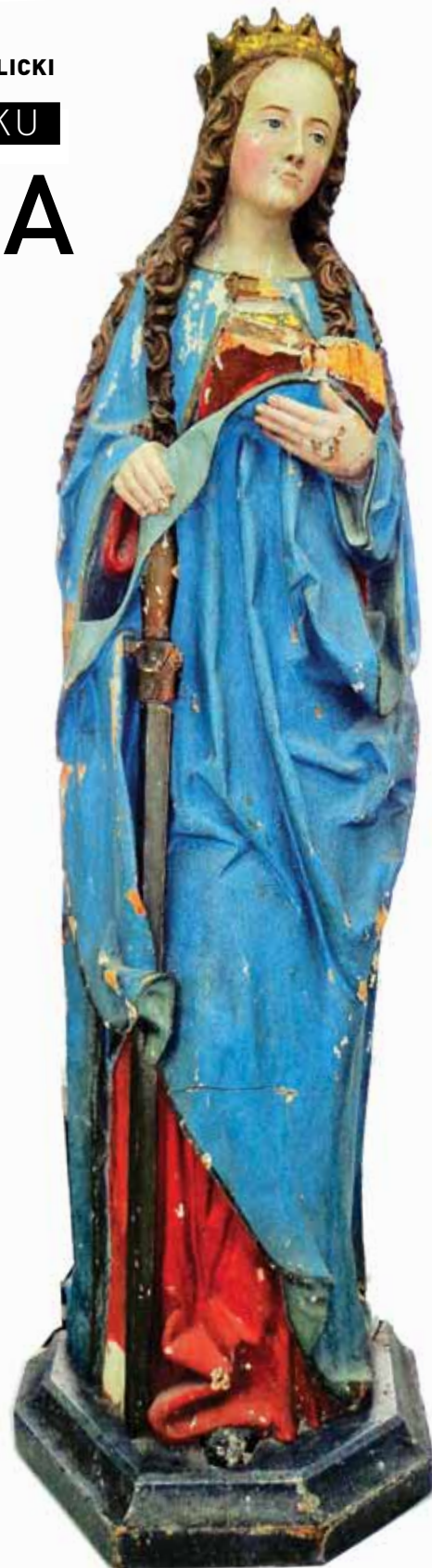
Rzeźba św. Katarzyny Aleksandryjskiej, tzw. Złotej Katarzyny z Katternecke we Wrocławiu, zbiory artystyczne KUL, nr inw. MU KUL III-1552

Na łamach jednego z zeszytów wrocławskiego czasopisma „Rübezahl” z 1868 r., w dziale poświęconym sprawom bieżącym, zamieszczone zostało następujące zapytanie: „Dokąd trafiła Katarzyna z Katternecke , która w latach 40. tego stulecia jeszcze tam stała? Jeśli ktoś posiada informacje na jej temat, proszony jest o kontakt. To samo pytanie dotyczy Niebieskiej Maryi z naprzeciwka, która także powinna znajdować się jeszcze we Wrocławiu” 1 . Na odpowiedź nie trzeba było długo czekać. Dwa zeszyty później redakcja opublikowała krótkie omówienie losów obu zabytków, rozpoczynając je wymownym zawołaniem: „One są tutaj!” 2 .