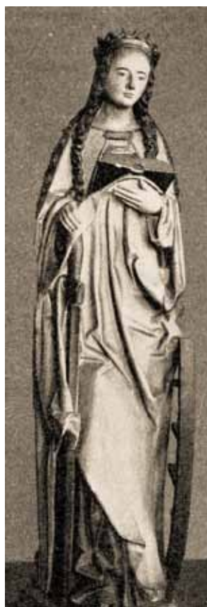
Archiwalna fotografia Złotej Katarzyny z Katternecke . Stan z 1928 r.

O ile figura Niebieskiej Maryi nigdy nie opuściła Wrocławia i przechowywana jest obecnie w tamtejszym Muzeum Narodowym 3 , o tyle losy rzeźby z Katternecke przez całe lata pozostawały nieznanne. Dopiero w 2011 r., podczas opracowywania przechowywanego w KUL zespołu średniowiecznych rzeźb śląskich, udało się ustalić, że jeden z zabytków to właśnie figura św. Katarzyny Aleksandryjskiej z Katternecke 4 .