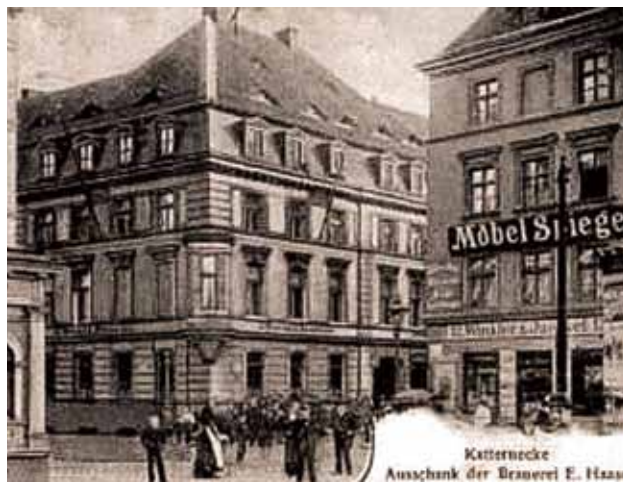
Przedwojenny widok Katternecke przy dawnym Breite- i St. Katharinenstraße [ob. Purykiniego i Św. Katarzyny], którego godło stanowiła niegdyś figura Złotej Katarzyny

W „Rübezah!” zrelacjonowane także zostało, w kontekście omawianej rzeźby, pewne zdarzenie natury obyczajowej, kiedy to „przed rokiem 1848 w wieczór sylwestrowy wielu ludzi słyszało na własne uszy rubaszne, grubiańskie, później zabronione nawet przez policję dialogi, prowadzone przy toaście noworocznym przez dwóch dwojgłosek – kiedy rynek był pełen – przy Katarzynie i Jerzym z widłami [niem. Gabeljürgen – tak zwyczajowo nazywano posąg Neptuna na fontannie pośrodku Nowego Targu] [...]” 22 . Biorąc pod uwagę lokalizację obu figur – Katarzyny na fasadzie narożnej kamienicy w północno-zachodniej części Nowego Targu i Jerzego na jego środku – domyślać się możemy, że owi „kawalarze” wykrzykiwać musieli do siebie na dużą odległość, ponad głowami licznie zebranych mieszkańców. Na podstawie przytoczonego opisu trudno jest jednoznacznie stwierdzić, czy chodzi tu