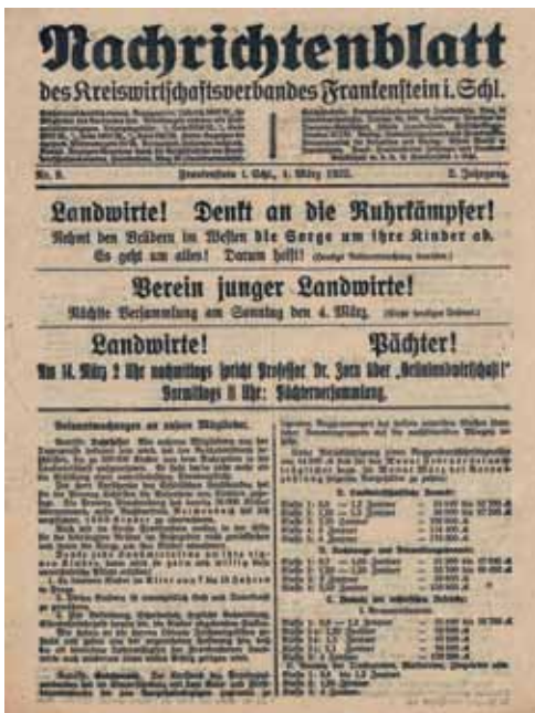
Po lewej: Strona tytułowa czasopisma „Nachrichtenblatt des Kreiswirt- schaftverbandes Frankenstein“, nr 9, Jahrgang 2, 1923 r.