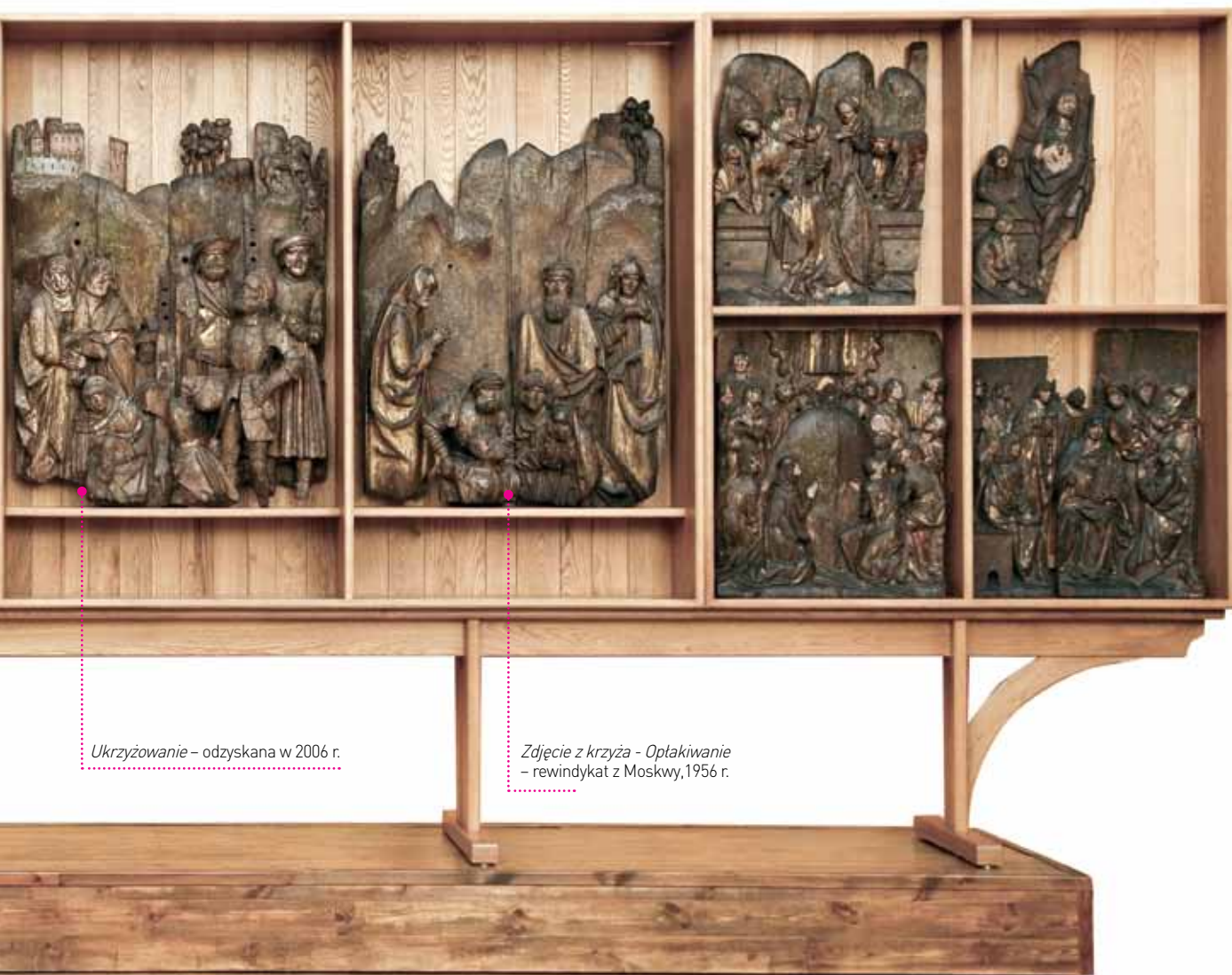
Ukrzyżowanie – odzyskana w 2006 r.