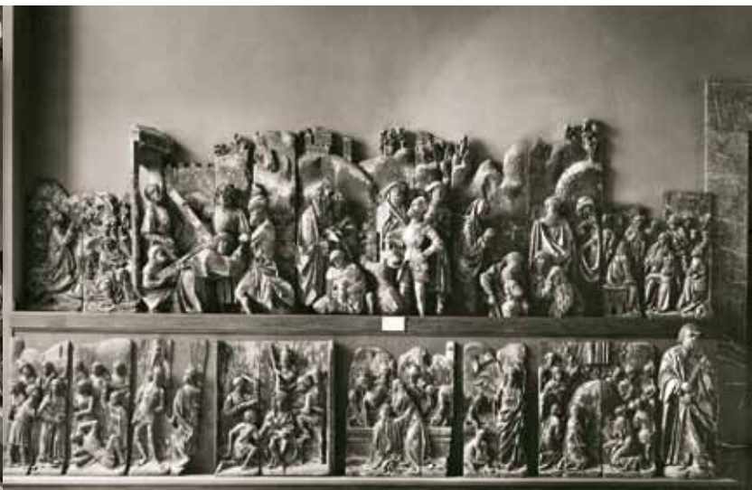
Płaskorzeźby ołtarza i figura św. Piotra z Wkryjścia na ekspozycji Muzeum Miejskiego w Szczecinie [Stadtmuseum], ok. 1914 r.