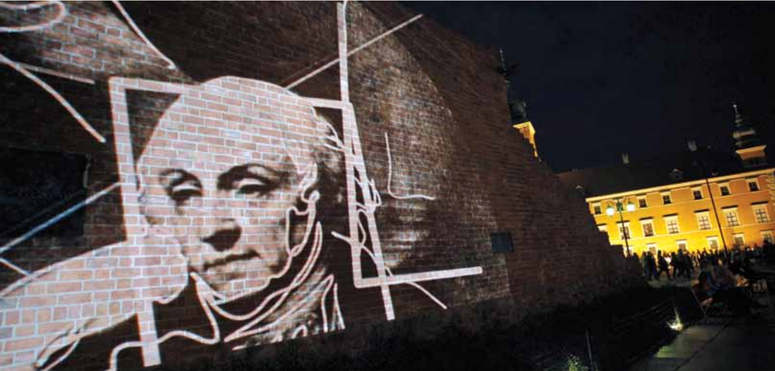
Fragment pokazu „Museum Utracone” zrealizowanego na murach obronnych Starego Miasta w Warszawie podczas Nocy Muzeów w 2011 r.

nisterstwo Kultury i Dziedzictwa Narodowego 1 jest głównym źródłem informacji i skutecznym instrumentem w walce o odtworzenie polskich zbiorów, zdewastowanych w wyniku rekwizycji, grabieży i zniszczeń. Po 2000 r. baza była wielokrotnie przebudowywana i modernizowana. Wynikiem tych prac jest sprawne, nowoczesne narzędzie, wyposażone w rozbudowany system gromadzenia oraz wyszukiwania danych, umożliwiające bardzo szybkie zgromadzenie materiału bibliograficznego, archiwalnego i ikonograficznego. Pozwala to na błyskawiczne przygotowanie wniosków restytucyjnych, stanowiących pierwszy krok do odzyskania utraconego obiektu.