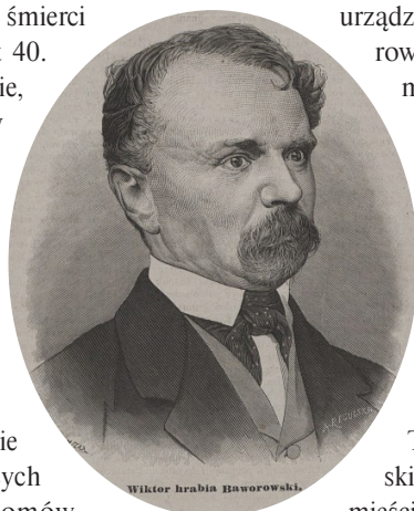
Portret Wiktora hr. Baworowskiego.

W momencie przeniesienia zbiorów do Lwowa (1861 r.) biblioteka Baworowskiego liczyła 15 571 druków (liczne dzieła histo-