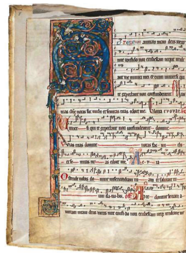
Graduale cistersiense . Rękopis w jęz. łacińskim, iluminowany XIII w. Notacja muzyczna: neumy lotaryńskie. Oprawa z epoki, deski i skóra. Jeden z najstarszych zachowanych w Polsce graduałów - Nad złoto droższe . Skarby Biblioteki Narodowej - Warszawa: Biblioteka Narodowa 2000, wersja elektroniczna