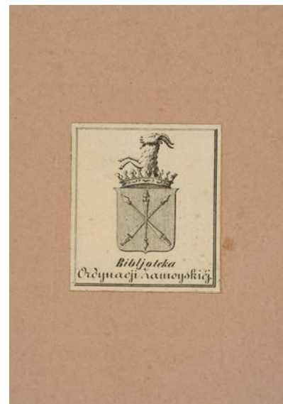
Eklibris: Z Biblioteki Ordynacji Zamojskiej z herbem „Jelita” BN rps BOZ 2054, t. 3