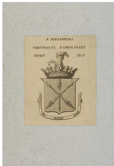
Eklibris: Z Biblioteki Ordynacji Zamojskiej Roku 1815 , w środku pola herb „Jelita” z Koźlorogiem nad koroną, pod tarczą herbową na wstędze zawołanie: To mniej boli BN rps BOZ 2054, t. 1