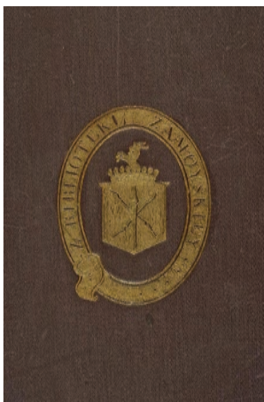
Superekslibris heraldyczny: herb „Jelita” z Kozłorogiem nad koroną, na wstędze napis: Z Biblioteki Zamojskiej BN rps BOZ 2054, t. 3